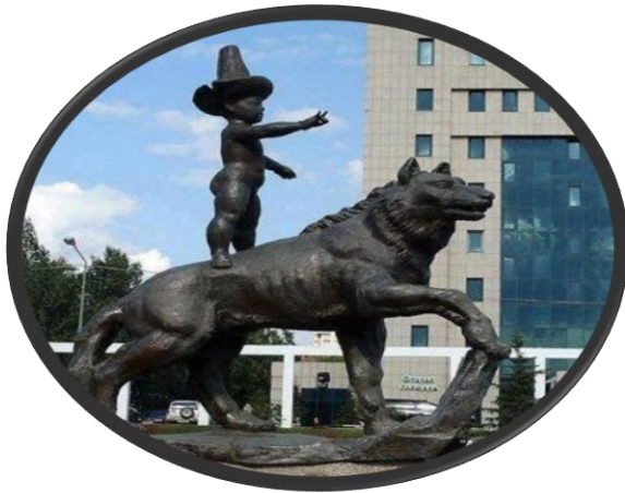
Kazakistan-Astana'da Bozkurt Heykeli

Hayvanlar: Destan anlatımlarındaki bu simge ve sembollerin birçoğu hayvan figürleri ile donatılmıştır. Bazen savaşılan, bazen yol gösterici olan, bazen binek olarak kullanılan ve kutsal sayılan, bazen de yerilen ve kötünün simgesi olarak kabul edilen hayvan sembolleri Türk destanlarında çokça karşımıza çıkmaktadır. Geyik Türk Destanlarında, dağların, vadilerin ve sarp kayalıkların görünüp kaybolan sihirli ve en güzel hayvanlarından. Türk lehçesinde alageyik olarak da bilinir. Anadolu ve Asya halı desenlerinde de geyik motifinin bolca işlendiği bilinmektedir.